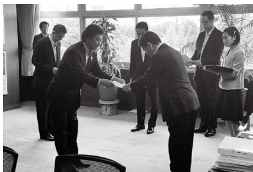
石井国土交通大臣から開催決定通知書を交付