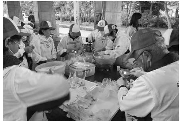
平成28年度佐渡市防災訓練での炊き出し訓練の様子