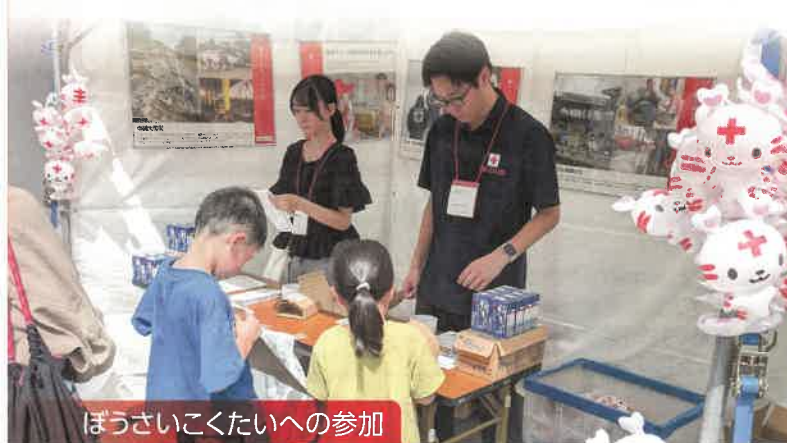
ぼうさいこくたいへの参加