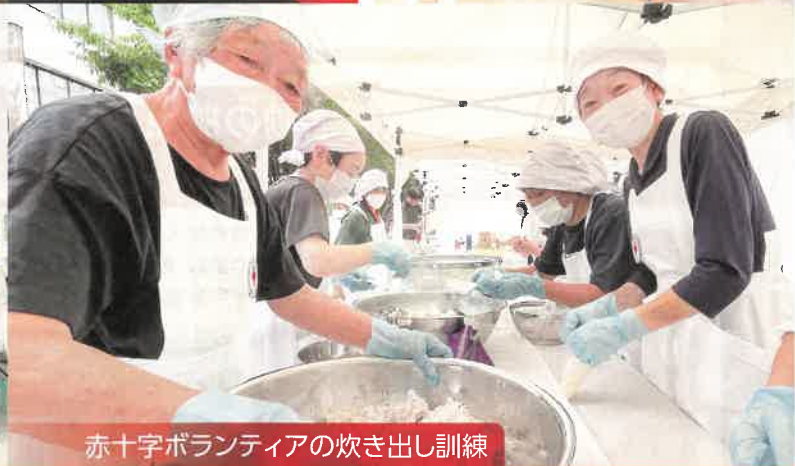
赤十字ボランティアの炊き出し訓練