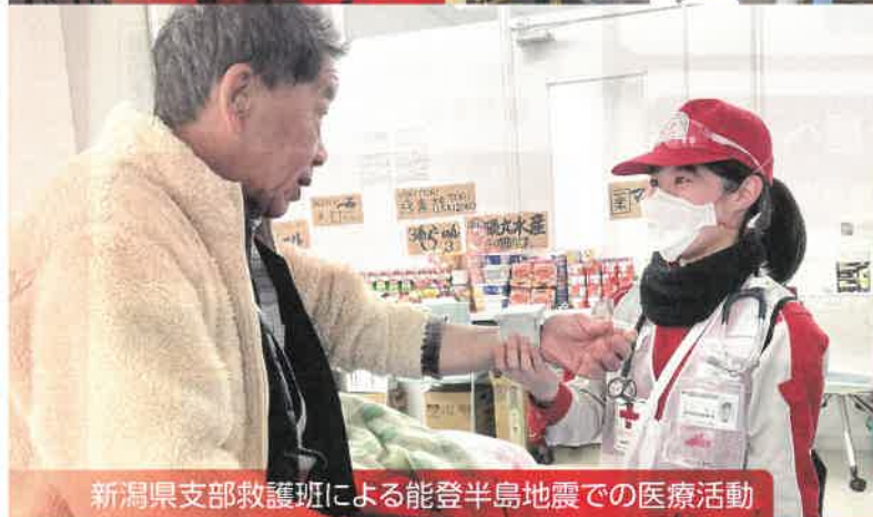
新潟県支部救護班による能登半島地震での医療活動