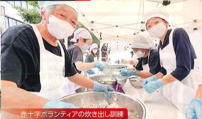
赤十字ボランティアの炊き出し訓練