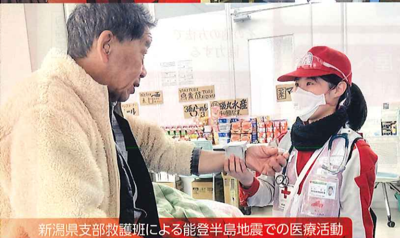
新潟県支部救護班による能登半島地震での医療活動