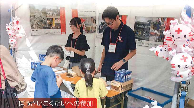
ぼうさいこくたいへの参加