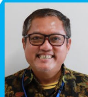
サトリオ (インドネシア)