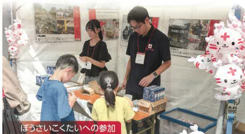
ぼうさいこくたいへの参加