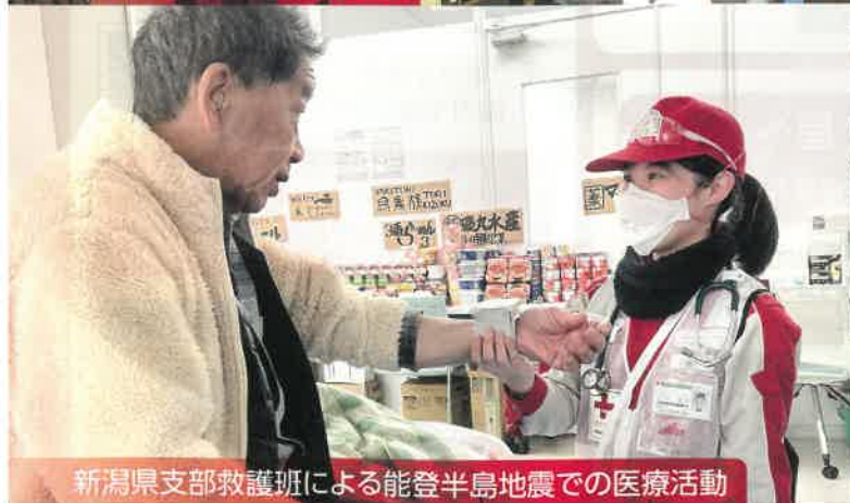
新潟県支部救護班による能登半島地震での医療活動