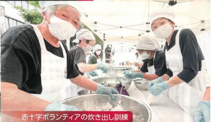
赤十字ボランティアの炊き出し訓練