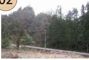
たてのこしやま 立残山

西三川砂金山の採掘地のひとつで、現在も人力によって掘り崩された急斜面を望むことができる。山裾には立残山堤から続く水路跡があり、掘り崩した土石に大量の水をかけて余分な土砂を洗い流し、比重の重い砂金を水路の底に溜める「大流し」という作業が行われた。このような新技術が戦国時代末期頃から導入されたことにより、産金量は飛躍的に増大した。