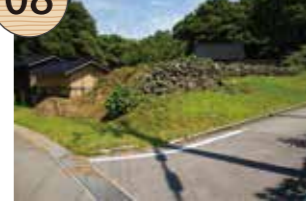
いしづ すいろあと 石積み水路跡

西三川砂金山では、堤に溜めた水を採掘地へ送るために、砂金採掘で出た余分な石を利用して石積みの水路が作られた。この水路跡は、立残山堤から山居山採掘地へ向かうもので、一部は道路によって寸断されているものの、石積みの上に平らな石を並べ、底面に水漏れ防止の粘土を貼って水を流した痕跡をみることができるといわれる。