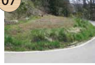
たてのこしやまつみあと 立残山堤跡

江戸時代、西三川砂金山では、大流しに用いる大量の水を溜めるための堤が各所に設けられた。この堤の水源は、約1キロメートル離れた場所にあり、江戸時代の絵図によると、途中トンネルを掘って水を引いていたことがわかる。閉山後、周辺の農地の溜池に転用されたが、現在は埋め立てられている。