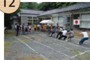
きゅうにし みかわしょうがっこうささがわぶんこう 旧西三川小学校笹川分校

明治13(1880)年の創立で、現在の校舎は、昭和37(1962)年に建てられたものである。昭和33年のピーク時には35名の児童が在籍したが、平成21(2009)年には4名となり、平成22年3月、129年の歴史に幕を閉じた。しかし閉校後も、笹川集落の住民によって、毎年7月に運動会、11月に収穫祭が開催されている。