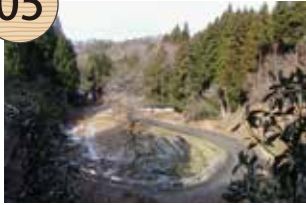
きんざんやくしよあと きんざんやくたくあと 金山役所跡・金山役宅跡

江戸時代、西三川砂金山には金山役所が置かれ、佐渡奉行所から2名の役人が派遣された。採取された砂金は、月末毎に役所に集められて計量され、奉行所へ納める分と、金掘りたちの取り分が決められた。役所跡と役宅(役人の住宅)跡は、現在も江戸時代の絵図と同一の場所にあり、石垣で囲まれた平坦面が役宅跡、道路を挟んで向い側の畑地が役所跡である。