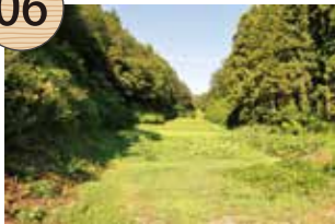
いのかみさわ 井ノ上沢

この付近には、かつて諏訪神社があり、その社領田の場所が井ノ上沢といわれている。弘治年間(1555~58)、松浪遊仁という人物によって砂金採掘にともない掘り潰されたという伝承があり、寛文年間(1661~73)に諏訪神社は隣の小立村に移転した。現在、水田は復興され、笹川集落の住民によって耕作されている。