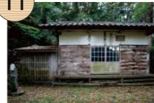
あみだどう 阿弥陀堂

江戸時代の絵図に描かれている建物で、内部の須弥壇には中世的な要素を持つ渦巻き紋様が彫られている。須弥壇内には、江戸時代前期の作と推測される阿弥陀如来像が安置されていることから、ほぼ同時期の建立と推測される。この付近には、中世に遡る山伏の修行場などもあり、かつての砂金採取に関わった人々の信仰の名残をとどめている。