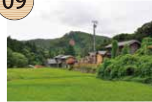
とらまるやま 虎丸山

西三川砂金山最大の稼ぎ場で、江戸時代の絵図には、山の上下二カ所で砂金採掘を行っていた様子が描かれている。虎丸山に至る大流し用の水路跡は約3.9キロメートルで、西三川砂金山の水路の中では二番目の長さである。現在も掘り崩されて露出した赤い山肌が見られ、かつて砂金山で栄えた笹川集落のシンボリック存在となっている。