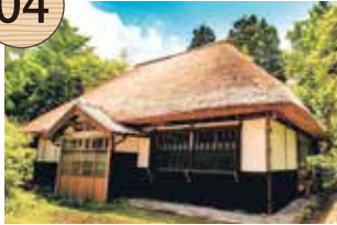
かね こかん さぶろう け 金子勘三郎家

江戸時代後期から明治5(1872)年の閉山まで砂金山の名主を務めた。主屋と土蔵は江戸時代後期の建物である。一方、納屋・牛納屋・便所は明治時代初期の建物であり、砂金山閉山後に、鉱業から農業へと生業が転換した様子を今に伝えている。(修理工事のため、敷地内への立ち入りはご遠慮願います)