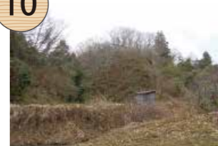
あらかみやま 荒神山

山伏が修行したと伝えられる岩山。江戸時代の絵図には、「この山に入ると祟りがあるとして、住民は大いに恐れた」という記述があり、近くには山伏が修行した滝跡もある。砂金山の発見・開発には、野山に分け入り修行する山伏が深く関わったとされており、笹川集落一帯には、その痕跡を示す信仰の場が数多く残されている。