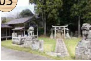
おおやますみじんじゆ 大山祇神社

文禄2(1593)年、砂金山の繁栄と安全を祈願して建てられた神社。相川の大山祇神社は、この神社を勧請したものといわれる。能舞台は、19世紀後半の建築と推定され、昭和20年代まで能が演じられていた。鳥居や狛犬などの石造物は、明治時代に笹川から北海道への移住者が寄進したものである。