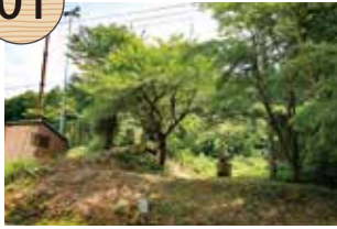
きゅうきんざん ささがわしゅうらくざい せき ひ 旧金山・笹川集落境の石碑

笹川集落は、戦国時代末期に、一カ月に砂金十八枚(約2.9キログラム)を上杉氏に納めたことから、「笹川十八枚村」と呼ばれるようになった。それ以前は、小立村地内である北部の「金山」と、西三川村地内である南部の「笹川」の2つの村に分かれており、現集落センター付近に立つ道祖神の石塔が、かつての村境の名残をとどめている。