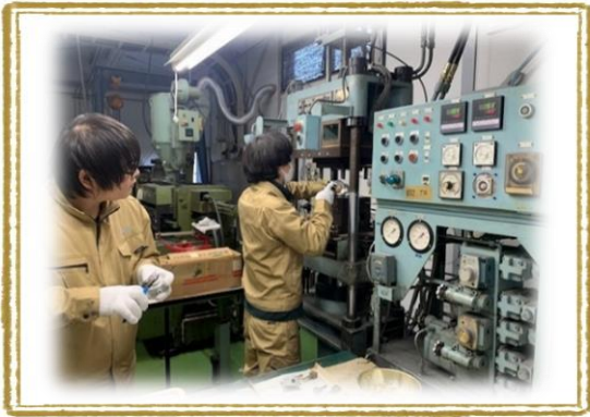
プラスチック部品の成形作業の様子