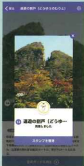
在景点收集喵喵猫印章