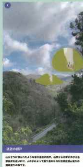
可以了解昔日情景的AR景点