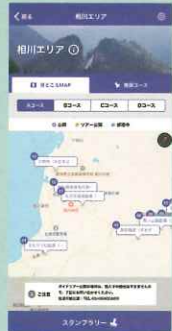
显示参观景点的位置