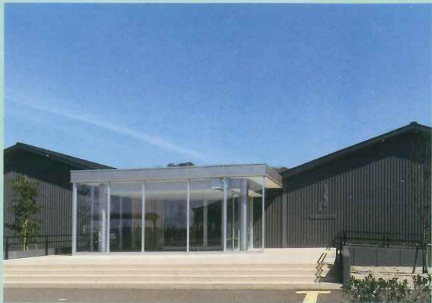
佐渡金银山的门户，寻访当地所需信息的传播据点