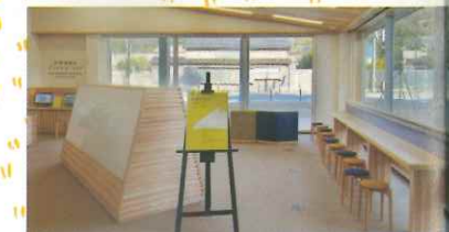
在资料区稍作休息