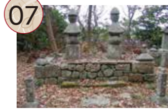
07 やましあきたしはか 山師(秋田氏)の墓

鶴子銀山を代表する山師であった秋田氏一族の墓で、二つの五輪塔とその周辺に一族の墓が建てられています。初代権右衛門は、秋田出身と伝わり、鶴子銀山の再開発によって得た利益をもとに、西五十里村(現在の西野)に金北山神社や吉祥寺を建立したと伝えられています。二代目権右衛門は、相川金銀山の山師となり、その子孫は幕末まで佐渡奉行所お抱えの山師として存続しました。