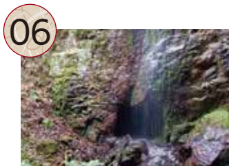
06 おおたきまおきわ 大滝間歩

屏風沢・仕出喜沢地区は、山師の初代秋田権右衛門によって、慶安年間(1648-1652)以降に開発が進められました。鶴子銀山のほぼ中央部にあり、尾根や沢沿いに露頭掘り跡や坑道掘りなどの採掘跡が集中しています。中でも屏風沢地区には、沢の斜面に露出していた鉱脈を追いかけながら地下に向かって斜め方向に掘った大規模なひ追い掘りによる採掘跡が残っています。