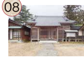
08 きんぼくさんじんじや 金北山神社