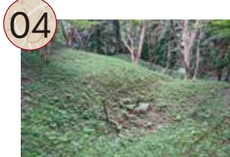
04 ひやくまいだいらちく 百枚平地区

鶴子銀山代官屋敷跡の東側に隣接する鉱山集落跡です。南向きの急斜面には、大小の不定形な平坦地が多く造成され、住居や作業場として利用されていたと考えられています。これは、銀の生産量が増加した16世紀後半に、この地に居住する鉱山労働者が増加して、急速に集落が成立・拡大した様子を示しています。17世紀半ば以降、銀の生産量減少と共に多くの人々がこの地から移住し廃絶したと考えられます。