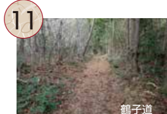
11 にしいかりみち つるしみち 西五十里道・鶴子道

鶴子銀山の繁栄と共に栄えた鉱山労働者の集落があったとされる場所です。史料によると、大工町や四十物町などの町名のほか、専得寺など複数の寺院があったことがわかっています。17世紀初頭には佐渡代官であった田中清六、河村彦左衛門の陣屋があったとされています。銀山の衰退とともに大工町や四十物町は相川へ集団移転し、相川の大工町や四十物町となったことが記録に残されています。