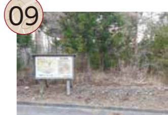
09 つるしとこやあと 鶴子床屋跡

寛永年間(1624~1643)、鶴子銀山の山師であった初代秋田権右衛門によって現在地に建立された神社で、金北山の里宮の一つとなっています。毎年4月中旬に祭礼が行われ、相川系の鬼太鼓や豆蒔きの翁の舞が行われています。金北山神社の祭礼は、鶴子銀山で利益を得た秋田権右衛門により始められたと伝えられており、神輿には「金銀山」「大盛り」の額が掲げられています。