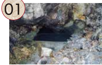
01 つるしこう 鶴子坑 (鶴子間歩・本口間歩)

江戸時代の記録によると、1595年(文禄4)に島根県の石見銀山から佐渡へやってきた山師が、「本口間歩」を開坑したと伝えられています。この本口間歩は、後に鶴子間歩や鶴子坑とよばれ、閉山までの主要坑の一つとして採鉱が続けられました。江戸時代の絵図も残されており、地中に複数あった鉱脈を狙って坑道が掘られていたことがわかっています。