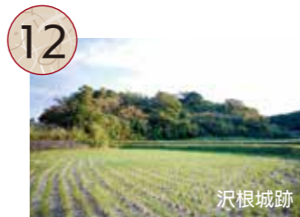
12 さわねもとじょうあと さわねじょうあと 沢根元城跡と沢根城跡

真野湾に面した沢根から鶴子銀山を経て、相川金銀山に至る鉱山道です。このうち、鶴子道は戦国時代末期の主要な鉱山道と考えられています。また、西五十里道は途中で鶴子道と合流し上相川まで延長されました。1628年(寛永5)に相川往還が整備されると、山越えの急峻なルートであった鶴子道や西五十里道は主要道ではなくなりますが、以後も地域間を往来する道路として利用されました。