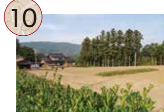
10 つるしたなかいせき 鶴子田中遺跡