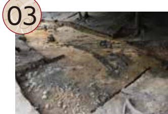
03 つるしあらまちいせき 鶴子荒町遺跡

16世紀末、越後国の戦国大名上杉景勝の佐渡支配に伴い、鶴子銀山の管理・運営のために設置されました。1603年(慶長8)に徳川幕府による支配に代わると、管理・運営の機能は相川に移されますが、17世紀半ば頃までその出先機関としての役割を担ったと考えられます。発掘調査の結果、敷地は機能の異なる3つの区域(上段:選鉱作業場、中段:製錬作業場、下段:管理施設)からなることが明らかになりました。