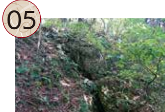
05 びょうふさわしできさわちく 屏風沢・仕出喜沢地区

百枚平地区は、鶴子銀山で最も初期に開発されたと考えられる代表的な採掘域です。鶴子銀山を発見した外山茂右衛門が、地元の領主に1ヵ月銀百枚を税として納めたことから、銀を採掘した場所に「百枚平」という地名が名づけられたと伝わっています。百枚平周辺の尾根や沢沿いには、直径5mを超える大型の露頭掘り跡が多く密集しており、かつて盛んに銀が採掘されていた様子が伺えます。