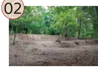
02 つるしぎんざんだいかんやしきあと 鶴子銀山代官屋敷跡

江戸時代の記録によると、1595年(文禄4)に島根県の石見銀山から佐渡へやってきた山師が、「本口間歩」を開坑したと伝えられています。この本口間歩は、後に鶴子間歩や鶴子坑とよばれ、閉山までの主要坑の一つとして採鉱が続けられました。江戸時代の絵図も残されており、地中に複数あった鉱脈を狙って坑道が掘られていたことがわかっています。