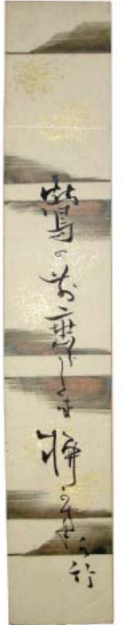
長谷川元良 (水竹)の句